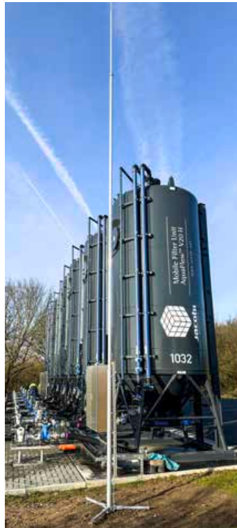
1,4 Millionen Euro haben wir in die neue Anlage investiert.

Aktuelle Messwerte und Informationen, auch dazu, wie sich PFAS im Alltag vermeiden lassen, finden Sie unter: stadtwerke-willich.de/pfas